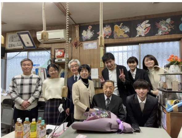
円満な事業引継ぎを喜ぶ両経営者とご家族の皆さん